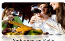
Ambiance en Salle