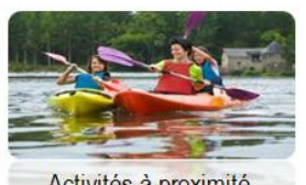
Activités à proximité