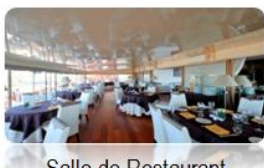
Salle de Restaurant