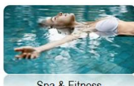
Spa & Fitness