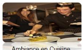
Ambiance en Cuisine