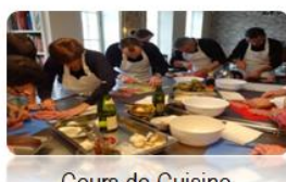
Cours de Cuisine